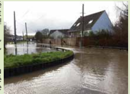
Saint-Sulpice - Le Val de l'eau, inondation avant travaux GEMAPI

Après le nettoyage, l'élagage des berges et le curage, l'eau s'écoule de nouveau, il est facile de remarquer le travail effectué par les techniciens ! Les prochaines fortes pluies devraient ne plus poser de problème aux habitants.»