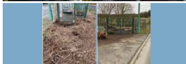
Entretien du bassin d'orage de Noailles AVANT / APRÈS