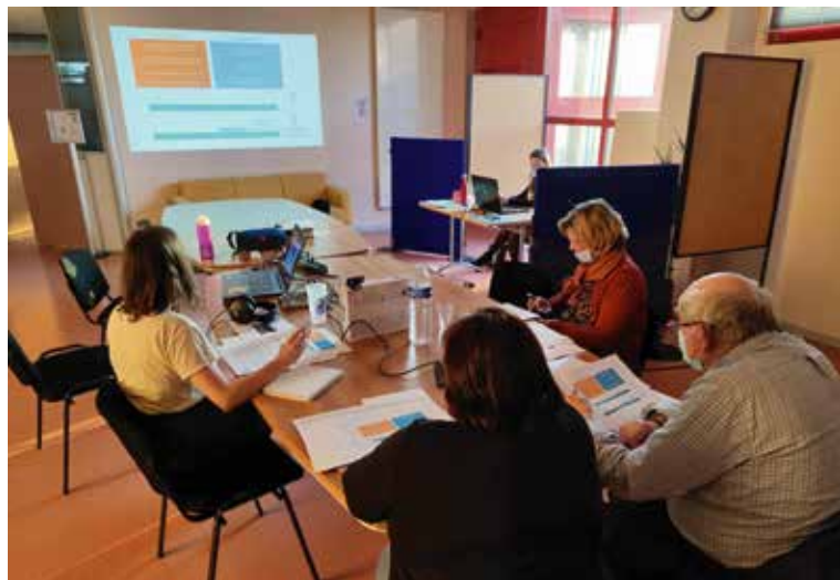
Près de 50 personnes ont suivi la réunion publique en visioconférence

Le projet de SCoT Thelloise a été soumis aux élus des communes de la CC Thelloise de janvier à février 2021. Une concertation interne a eu lieu pour décider de l'intégration de ces remarques aux documents selon leur pertinence.