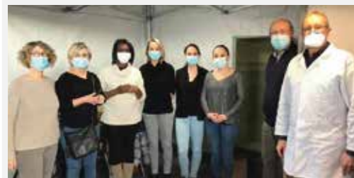
Tous les médecins et infirmières viennent de Chambly, Bornel, Neuilly-en-Thelle et le Mesnil-en-Thelle. Centre de vaccination le plus proche de chez vous : sante.fr

La prise de RDV s'effectue uniquement via Doctolib.fr ou par téléphone au 01 39 37 27 17 entre 14 et 18 h. Ce sont 12 médecins et 36 infirmières qui vont se relayer sur les 12 créneaux proposés par semaine, de 4 h de vaccination chacun.