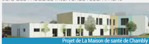
Projet de La Maison de santé de Chambly