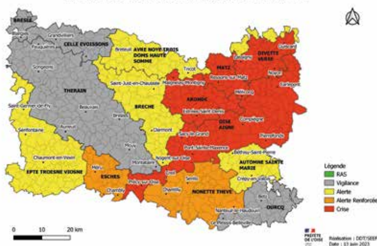
Cartographie des zones d'alerte sécheresse concernées par des recommandations ou des mesures de restriction imposées par l'arrêté sécheresse

Félicitations à Georef95, qui a su s'imposer face à l'entreprise MSI... ainsi qu'à l'ensemble des participants de cet événement placé sous le signe de la bonne humeur.