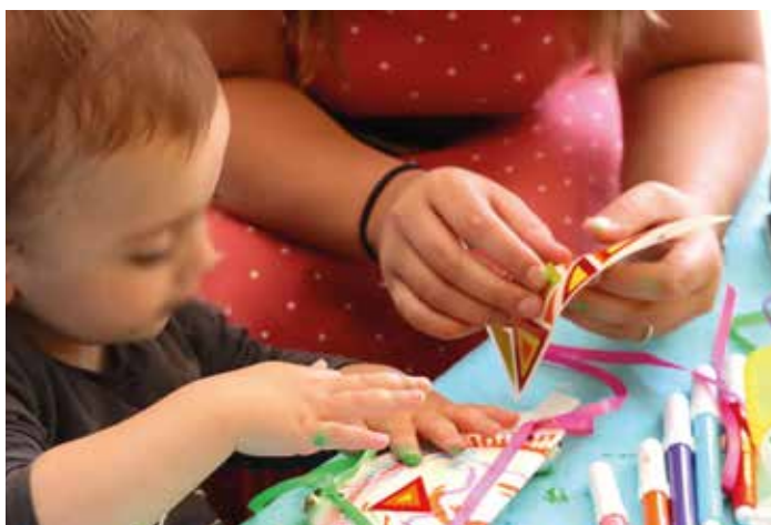
Préparation de la fête de la musique Atelier Parents/Enfants

Quels que soient le lieu de résidence et la situation professionnelle des familles, le service répond aux attentes des parents pour un besoin occasionnel ou régulier. Premier pas vers l'école maternelle, la halte-garderie est avant tout un lieu d'activités diverses et de rencontres avec d'autres enfants.